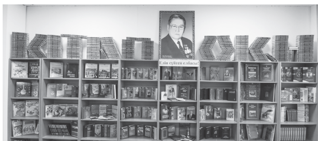
Білім сүйенісін сабақта

Алдағы жоспар, жылыжайды «ақылды жылыжай» режиміне ауыстыру. Бұл мақсатта оқушылар жүйелі жұмыс істеуді бастаған. Қажетті құрылғылар толық жеткізіліп, аз уақытта жаңа тыныс ашылар сәт жақын. Егер ізденіс сәтті аяқталса, жылыжайдың суғару, жарықтандыру ісін автоматтандыру іске асатын болады.