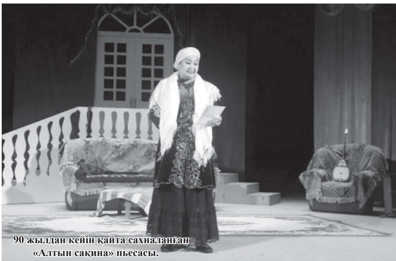
90 жылдан кейін қайта сахналанған «Алтын сақина» пьесасы.

Қазір халық жаппай қолданатын тарих, әдебиет оқулықтарынан Сәдуақасұлы, Кеменгерұлы, Әділұлы есімін ұшырастырмайсыз. Тарихты қасақана бұрмалау деген – осы. Саясилаған тарих театрды қашан және кімнің шығармасымен ашылды дейді? Оқиғаны қалай бұрмалайды? Мұны да айттайық. Бұл «тарих» ұлт театры сол 1926 жылы 10 қаңтарда (кей деректерде 13 қаңтарда) М.Әуезовтің «Еңлік-Кебек» пьесасымен ашылды дейді. Ал енді бұл тарихтың неге тырнақшада екеніне тоқталайық.