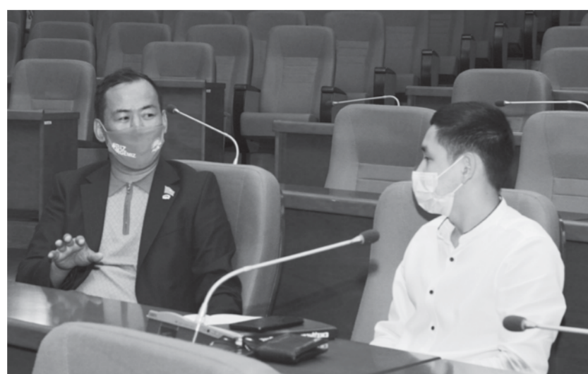
– Жастар саясатын жетілдіруде «Социум Қызылорда» қоғамдық қорымен бірнеше ігі бастаманың себепкері болдыңыз. Енді депутат ретінде жастарға не істей жатырсыз?

– Пандемияға байланысты қолымыз байланып отыр. Мысалы, қалаға қарасты ауылдарға барып, жастармен кездесу ұйымдастыру жоспарда бар. Дегенмен қазіргі кезде бізде жастар саясатының жағдайы жаман емес. Қазір әр ауылда, ауданда жастар орталығы, қалада ресурстық орталық бар. Жастарға арналған «Серпін», «Дипломмен ауылға» секілді қанаша мемлекеттік бағдарламалар бар.