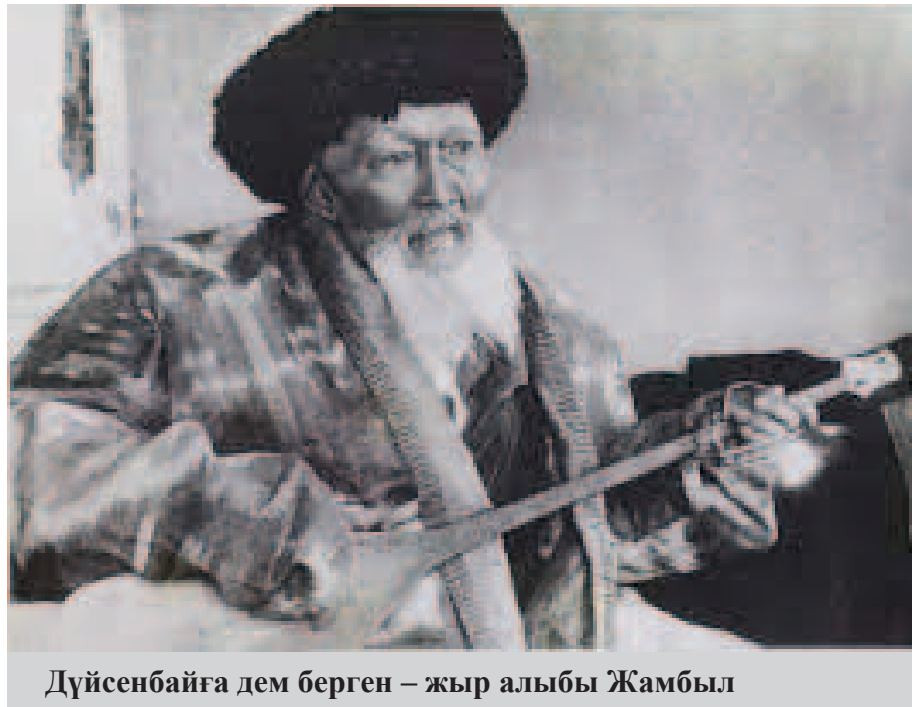
Дүйсенбайға дем берген – жыр алыбы Жамбыл

Бұлдан білетініміз – Жамбылдың сайыпқыран сарбазға өлеңмен тілек өргені. Өкінішке қарай, оның нақты мәтіні мен мазмұны қандай болғанынан