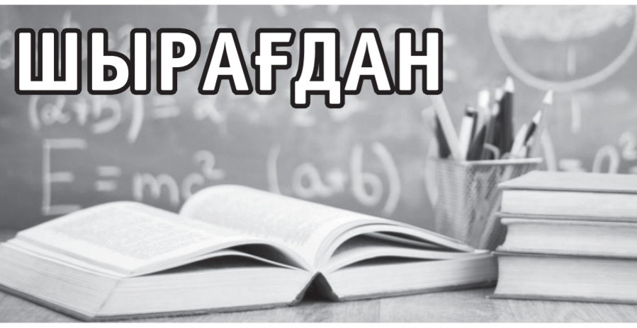
Бүгін «Шырағдан» айдары арқылы «Бірқазан» елді мекеніндегі №145 орта мектебі туралы айтатын боламыз.