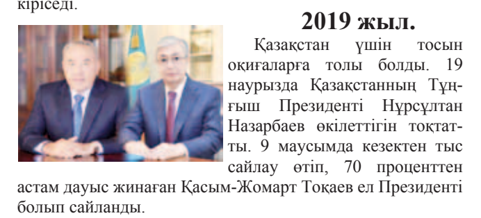
2019 жыл. Қазақстан үшін тосын оқиғаларға толы болды. 19 наурызда Қазақстанның Тұңғыш Президенті Нұрсұлтан Назарбаев өкілеттігін тоқтаты. 9 маусымда кезектен тыс сайлау өтіп, 70 проценттен астам дауыс жинаған Қасым-Жомарт Тоқаев ел Президенті болып сайланды.