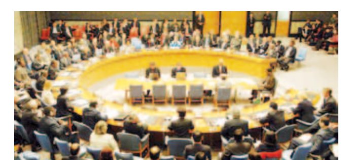
2018 жыл. 1 қаңтардан бастап Қазақстан БҰҰ Қауіпсіздік кеңесіне төрағалық етті. Төрағалықтың негізгі мақсаты Орталық Азия мен Ауғанстан бойынша құжат қабылдау болды. Кеңестің тұрақты емес мүшелері бұл қызметке кезекпен кіресі.