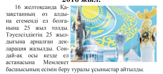
2016 жыл. 16 желтоқсанда Қазақстанның өз алдына егеменді ел болғанына 25 жыл толды. Тәуелсіздіктің 25 жылдығына арналған декларация жазылды. Сондай-ақ осы кезде ел астанасына Мемлекет басшысының есімін беру туралы ұсыныстар айтылды.