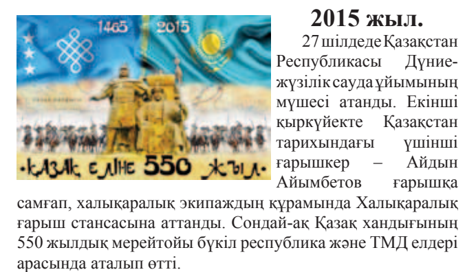
2015 жыл. 27 шілдеде Қазақстан Республикасы Дүниежүзілік сауда ұйымының мүшесі атанды. Екінші қыркүйекте Қазақстан тарихындағы үшінші ғарышкер – Айдын Айымбетов ғарышқа самғап, халықаралық экипаждың құрамында Халықаралық ғарыш стансасына аттанды. Сондай-ақ Қазақ хандығының 550 жылдық мерейтойы бүкіл республика және ТМД елдері арасында аталып өтті.