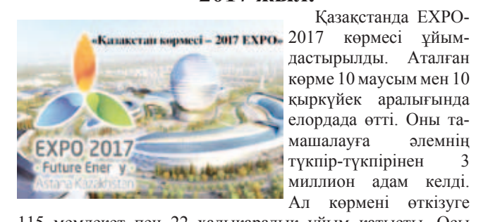
2017 жыл. Қазақстанда EXPO-2017 көрмесі ұйымдастырылды. Аталған көрме 10 маусым мен 10 қыркүйек аралығында елордада өтті. Оны тамашалауға әлемнің түкпір-түкпірінен 3 миллион адам келді. Ал көрмені өткізуге 115 мемлекет пен 22 халықаралық ұйым қатысты. Осы жылдың 26 қазанында Мемлекет басшысының қазақ тілін латын әліпбиіне көшіру туралы жарлығы қабылданды.