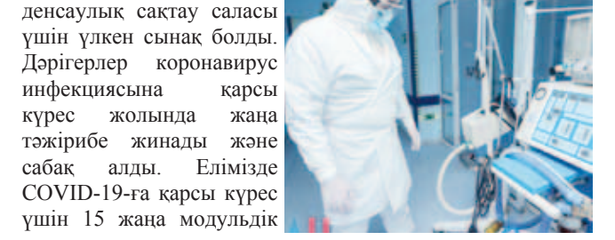
2020 жыл. Бұл жыл еліміздің денсаулық сақтау саласы үшін үлкен сынақ болды. Дәрігерлер коронавирусы инфекциясына қарсы күрес жолында жана тәжірибе жинады және сабақ алды. Елімізде COVID-19-ға қарсы күрес үшін 15 жаңа модульдік жұқпалы аурулар ауруханасы ашылды. Қазақстанда міндетті әлеуметтік медициналық сақтандыру жүйесі іске қосылды.