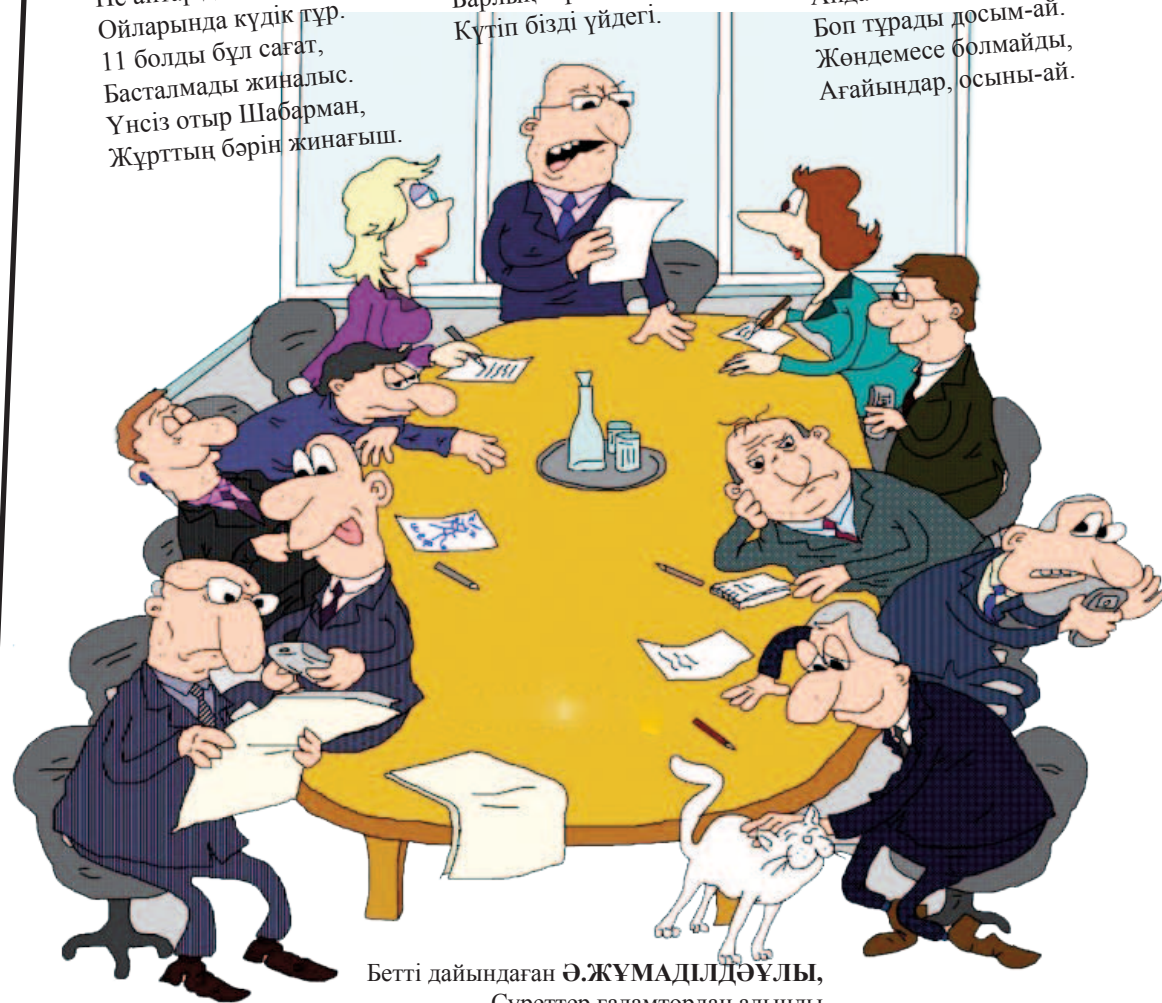
Бетті дайындаған Ә.ЖҰМАДИЛДҰҰЛЫ

Анда-санда осылай, Боп тұрады досым-ай, Жөндемесе болмайды, Ағайындар, осыны-ай.