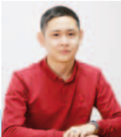
Бетті дайындаған: Аслан НҰРАЗҒАЛИИ