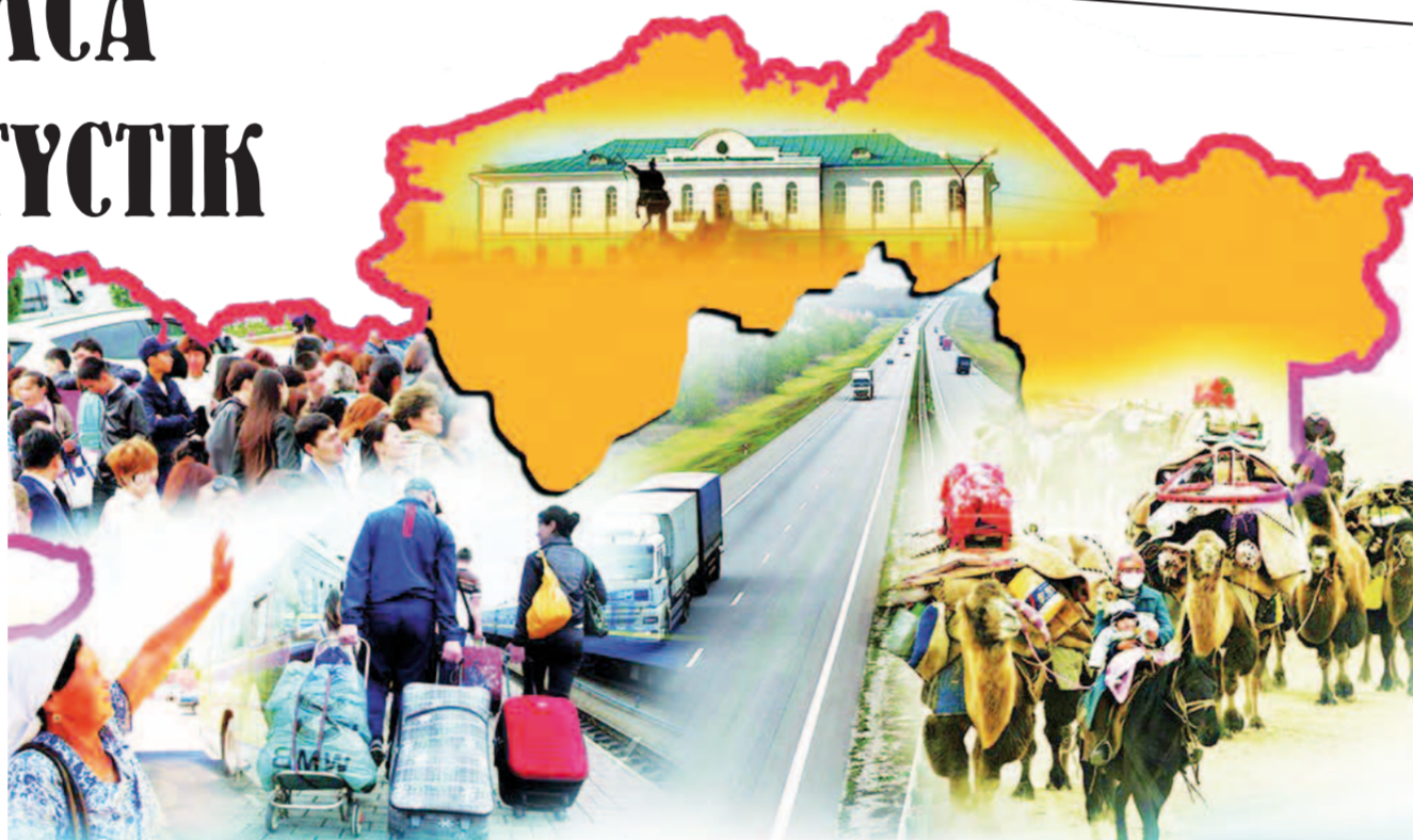
Өзімізді алсақ, бүгінде Қызылорда облысының халқы 1 миллионға жуықтап қалды. Сырттан келіп халық санын арттырып жатқандар да бар мұның ішінде.

Расында, бұл – «Ұлы көш». «Жау жар астында...» деген көнеден қалған сөз бар. Кімнің не ойы бары бір Аллаға аян. Сондықтан ұшқан құстың қанаты талатын қазақтың ұлан ғайыр атырабын қорғау үшін солтүстікті қазақыландыру маңызды рөл атқарады. Оның үстіне соңғы жылдары еліміздің солтүстігіндегі тұрғындардың саны азайып барады. Бүгінгі біздің айтамыз оңтүстіктен, оның ішінде Қызылордадан адамдардың солтүстікке көшу қарқыны, ондағы халықтың хал-ахуалы жайында. Социолог мамандардың айтуынша, көрші Ресейге қоныс аударғандардың басым бөлігі солтүстік өңірлердің азаматтары. Сөзімізге тұздық болсын, осы тұста сандарды сөйлете кетейік. Мысалы, 2018 жылы елімізден 40 мыңға жуық адам көшсе, соның 90 проценті Ресейді таңдаған. Алдын ала жасалған болжам бойынша 2050 жылдарға қарай аталған аймақта халық саны 1 миллионға дейін азаюы мүмкін. Бұған тиісінше, оңтүстік тұрғындарының саны күрт өсу үстінде.