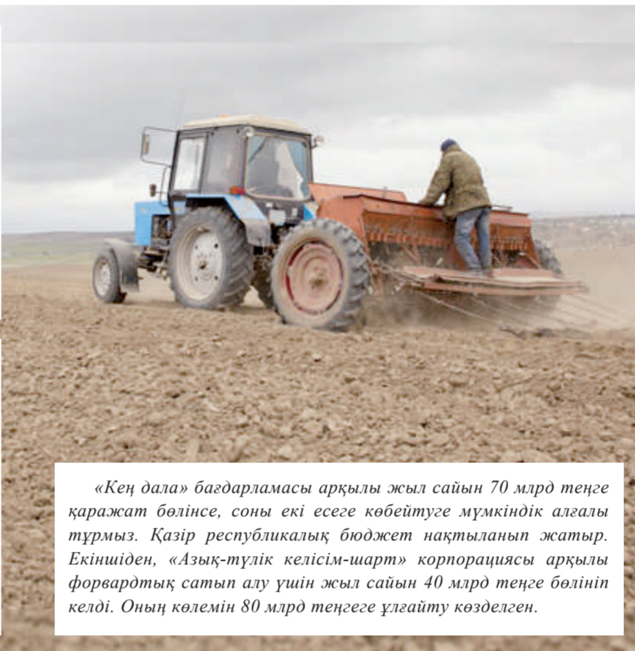
«Кең дала» бағдарламасы арқылы жыл сайын 70 млрд теңге қаражат бөлінсе, соны екі есеге көбейтуге мүмкіндік аламыз тұрмыз. Қазір республикалық бюджет нақтыланып жатыр. Екіншіден, «Азық-түлік келісім-шарт» корпорациясы арқылы форвардтық сатып алу үшін жыл сайын 40 млрд теңге бөлініп келді. Оның көлемін 80 млрд теңгеге ұлғайту көзделген.