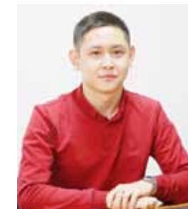
Бетті дайындаған Аслан НҰРАЗҒАЛИП Суреттер ашық дереккөзден алынды