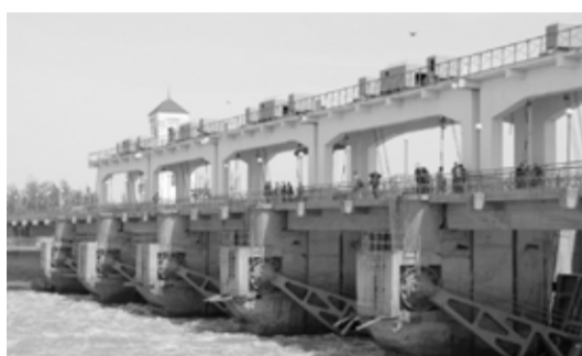
Тасбөгет атауы қалай берілді?