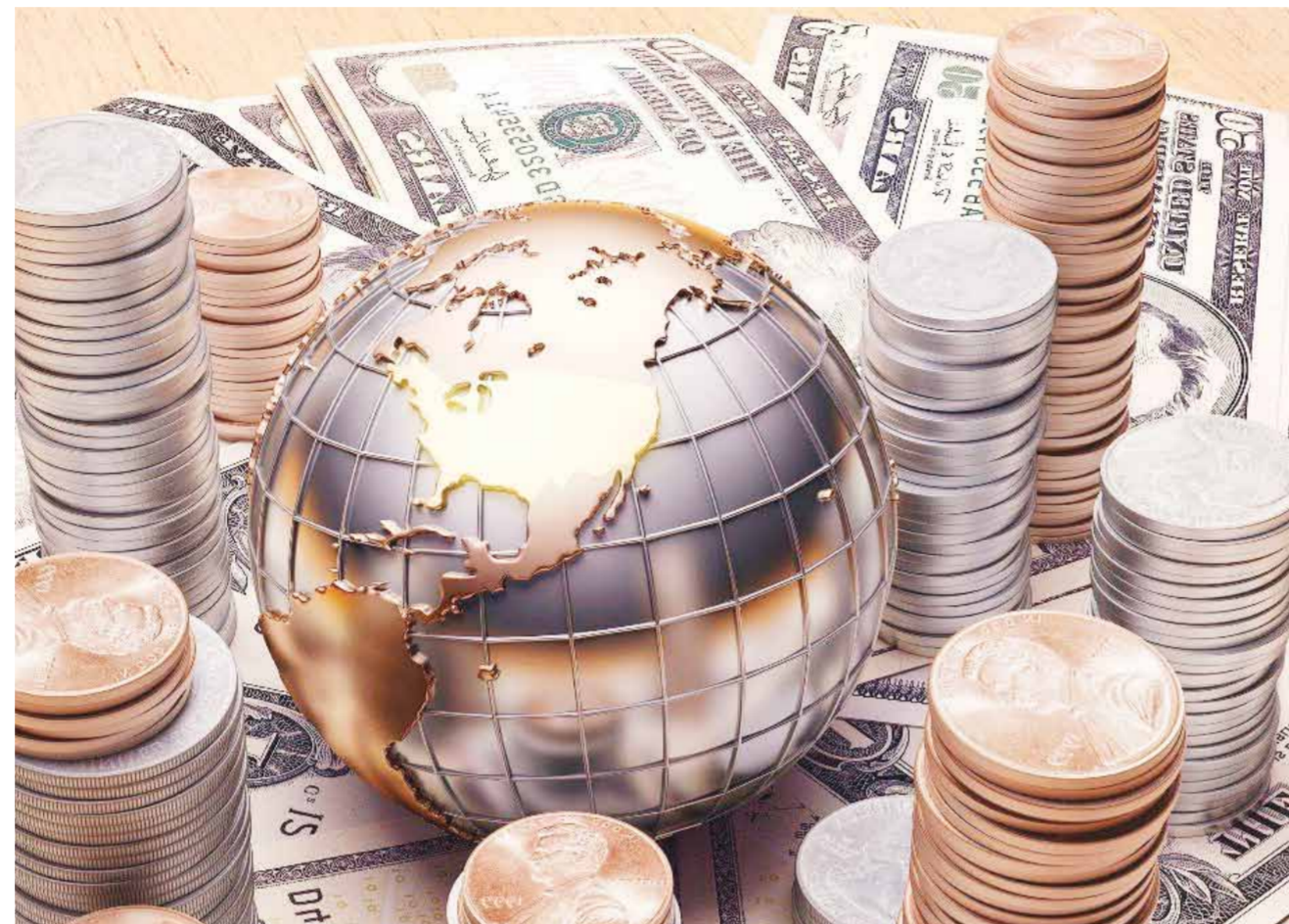
Коллаж ашық деректерден алынды.

– Соңғы уақытта бюджет тапшылығы ЖІӨ-ге шаққанда шамамен