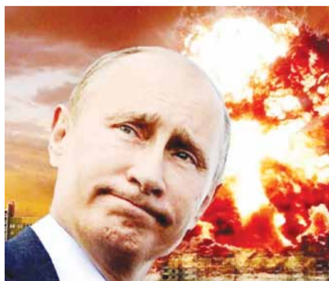
Коллаж «Abaik.kz»-мен алынды.

Біз бұл мәселені неге көтердік? Өйткені қазанның басында Ресей президенті Владимир Путин «Валдай» форумында «ядролық қаруды сынамау туралы құжаттың ратификациясын неге кері қайтармасқа?» деп пікір білдірген. Ресей басшысының бұл сөзі көп ұзамай шындыққа айналды. 17 қазанда Ресейдің Мемлекеттік Думасы ядролық қаруды сынамау туралы құжаттың