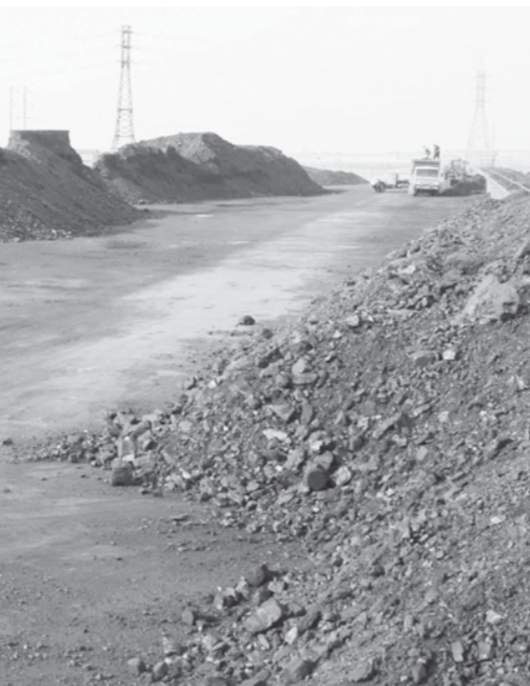
Осыған сәйкес, аймақ басшысы халықты көмірмен қамту шараларын уақытылы қабылдап, қысқы маусымда қажетті көмір қорын жинақтауды ойдағандай өткізуді және бағалардың өсуіне жол бермеуді қатаң тапсырды.