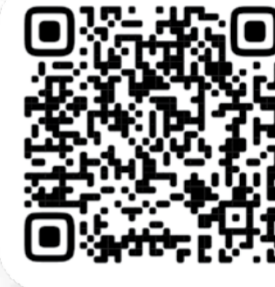
Бейнәжзба нұсқасын көру үшін