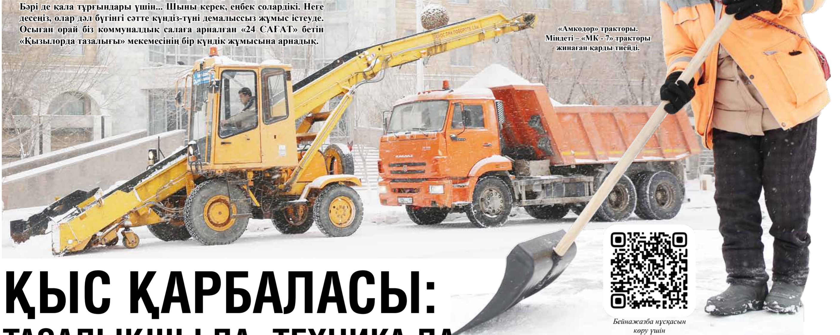
«Амкор» тракторы. Міндеті – «МК-7» тракторы жинаған қарды тсейді.