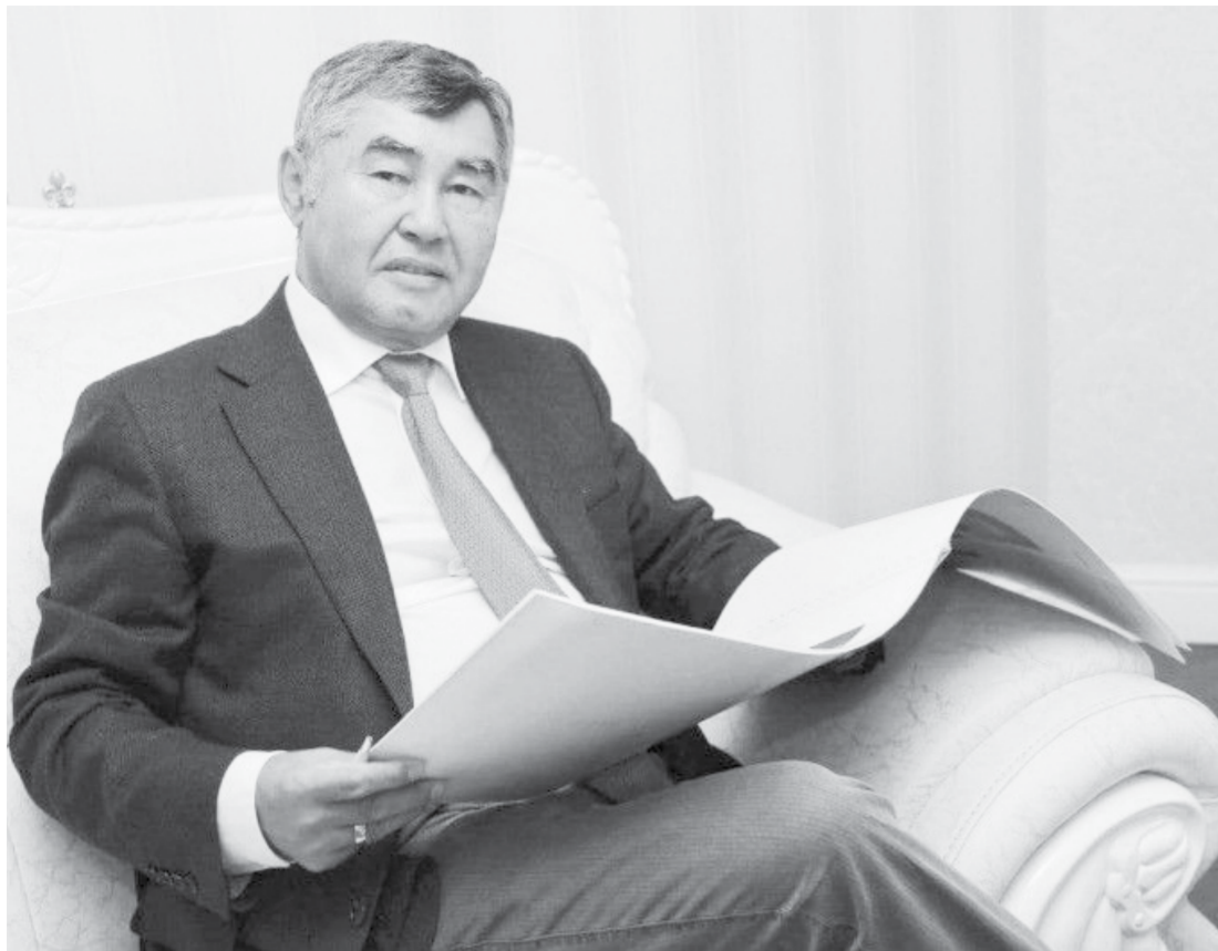
Бакберген ДОСМАНБЕТОВ, қоғам және мемлекет қайраткері, ҰҒА академигі, экономика ғылымдарының докторы, «Болашақ» университетінің құрылтайшысы: