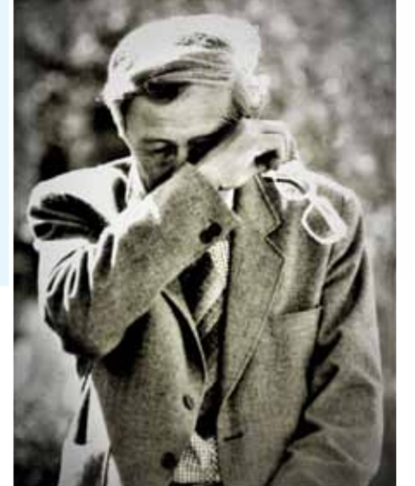
Атақты композитор Нұрғиса Тілендиевтің сан қырлы суреттері менде жеткілікті. Мына суретте ол «Әлқиса» күйін орындауда.