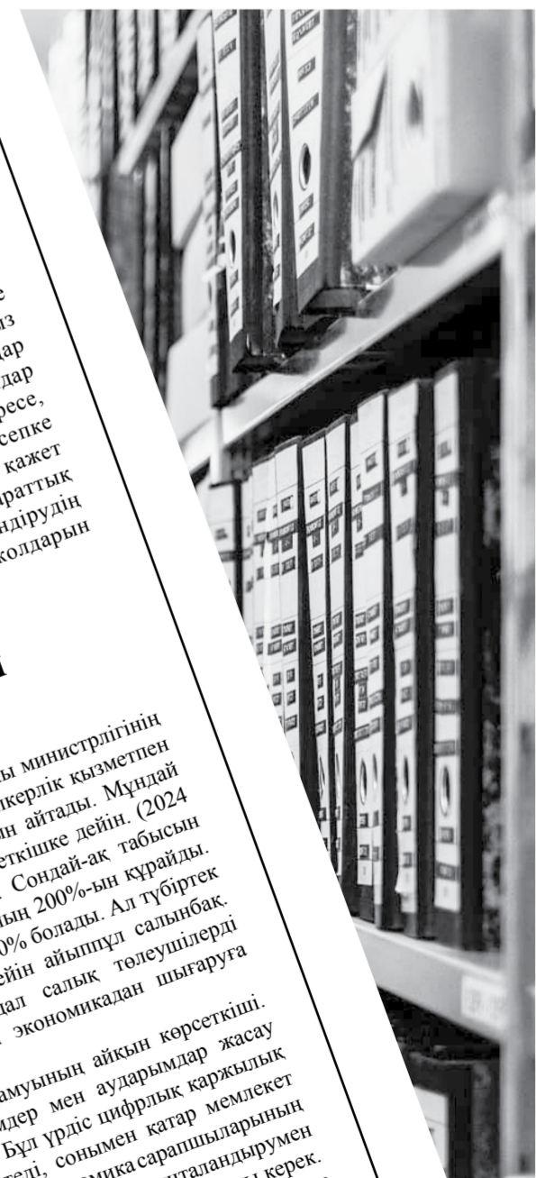
София ГЕИМРӨЛӘТ Басы 1-бетте