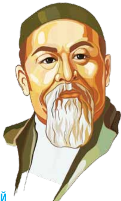
АБАЙ ҚҰНАНБАЕВ –180