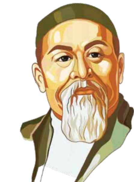
АБАЙ ҚҰНАНБАЕВ — 180