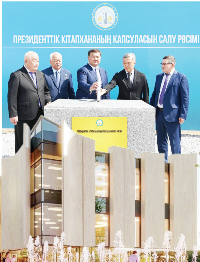
ПРЕЗИДЕНТТІК КІТАПХАНАНЫҢ КАПСУЛАСЫН САЛУ РӘСІМІ

Жақында облыс орталығында Мемлекет басшысының тапсырмасына сәйкес еліміздегі үшінші Президенттік кітапхананың қапсуласын салу рәсімі өтті. Жаңа нысан Президент саябағы аумағында бой көтереді. Бұл жоба аймақтың мәдени-рухани әлеуетін арттыруға бағытталған маңызды қадамдардың бірі болмақ. Сонымен қатар қала тұрғындары үшін тиімді әрі жайлы мәдени кеңістік қалыптастыруға мүмкіндік береді. Жоба аясында кітапхана қоры мыңдаған әдеби кітаппен толықтырылады. Бұл өңір жастарының білімге деген қызығушылығын арттырып, ғылыми ізденістеріне жол ашады.