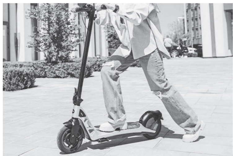
Сурет шыққан дереккөзден алынды

Осыған байланысты қалалық Полиция басқармасы велосипед және самокат пайдаланушыларын жол қозғалысы ережелерін қатаң сақтауға шақырады. Велосипедпен немесе самокатпен жаяу жүргіншілер өткелінен өту кезінде көлік құралынан түсіп, оны жетектеп өту міндетті. Бұл талап жүргізушілердің велосипедші немесе самокатшының қозғалысын дер кезінде байқап, жол-көлік оқиғаларының алдын алу үшін енгізілген.